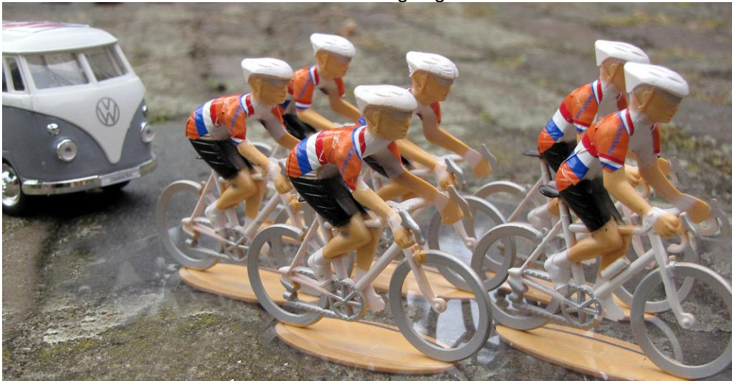
Het rabobankteam in de sprint.