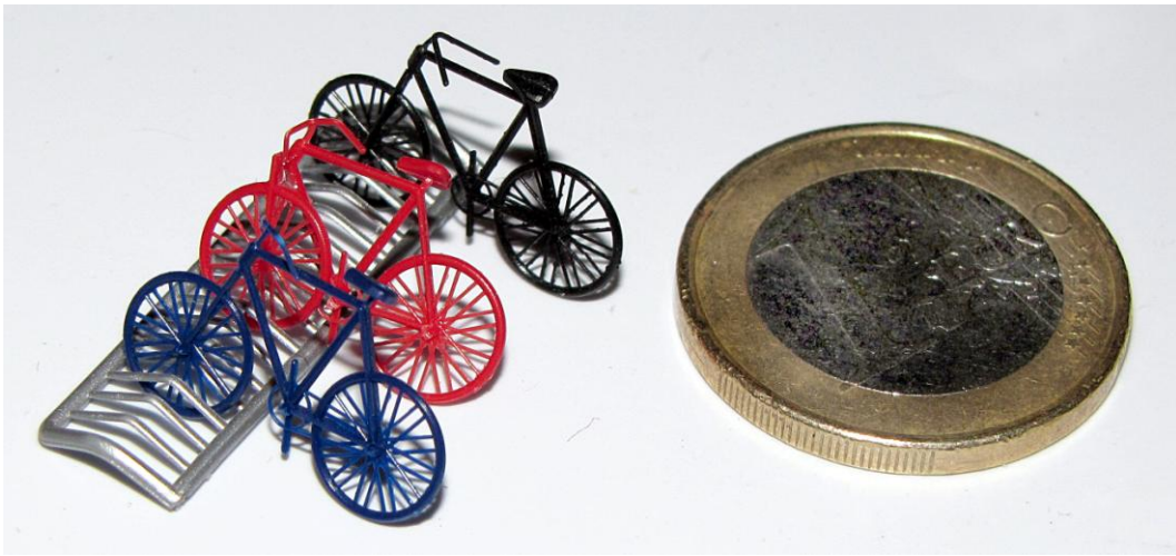
De fietsenstalling is gratis