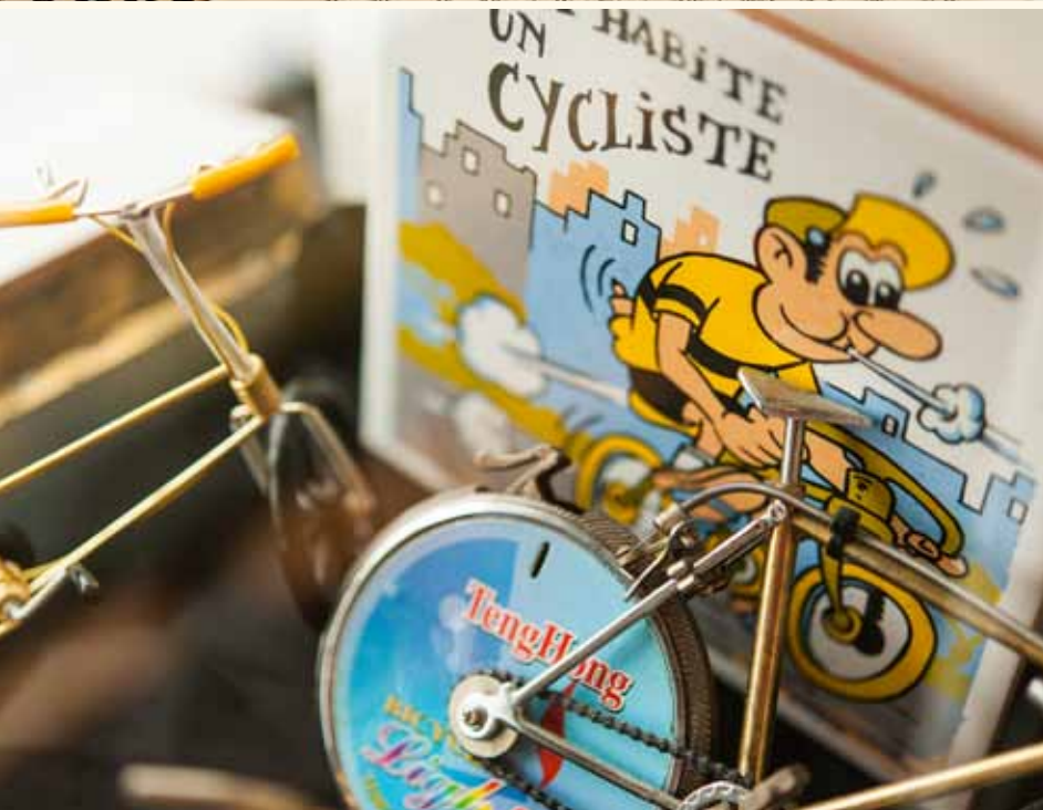
De miniatuurfietsen zijn gemaakt van uiteenlopende materialen: metaal, kunststof, hout en ijzerdraad.

dan ook verspreid door de hele woning. In vitrinekasten, op schappen, zelfs op de grond. “Tot enkele jaren geleden stoffte een hulp in de huishouding al mijn modelletjes af. Nu ik met pensioen ben, mag ik de collectie zelf schoon houden. Mijn vrouw begint er in elk geval niet aan. Ze wordt gek van die kleine dingen.”