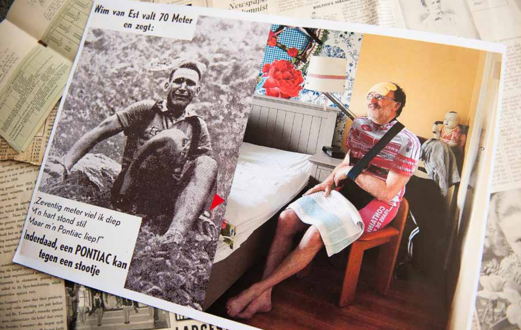
Links op de foto staat Wim van Est na zijn val in de Tour de France van 1951.